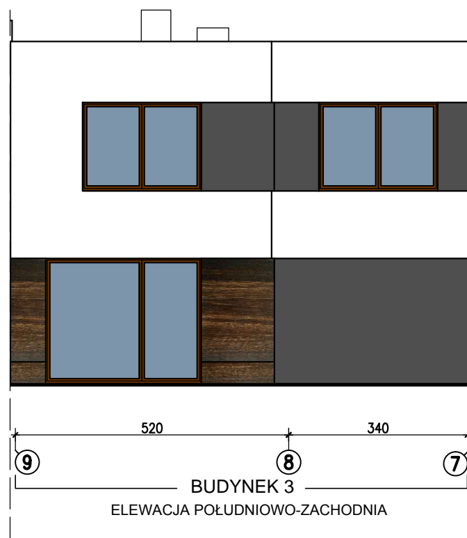
BUDYNEK 3 ELEWACJA PÓŁUDNIOWO-ZACHODNIA