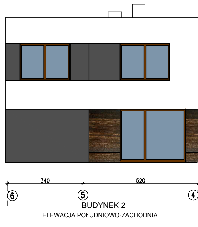
BUDYNEK 2 ELEWACJA PÓLUDNIOWO-ZACHODNIA