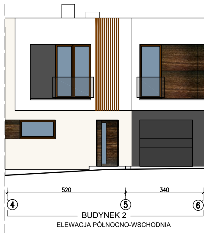
BUDYNEK 2 ELEWACJA PÓLNO-CWISODNIA